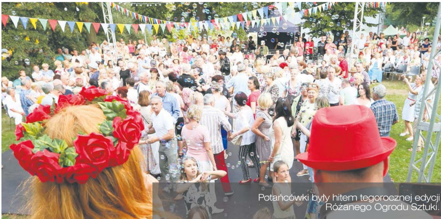
Potańcówki były hitem tegorocznej edycji Różanego Ogrodu Sztuki.

W tym roku 125 tys. osób odwiedziło teren imprezy, przyplłynęło ponad 30 żaglowców i jachtów, a na scenie głównej wystąpiło 300 artystów. Nie mniejszym zainteresowaniem cieszyła się IX edycja Międzynarodowego Festiwalu Sztucznych Ogni Pyromagic 2016 . W rywalizacji świetlnych obrazów na szczecińskim niebie zwyciężyła firma Sugyp ze Szwajcarii. W ciągu dwóch dni pokazy obejrzało łącznie ok. 140 tys. osób . Tegorocznemu wydarzeniu towarzyszyło szereg imprez – Water Show, Baltica Summer Cup, Firgefighter Combat Challenge, Szczecin Music Live i Baltic Polonez Cup Race .