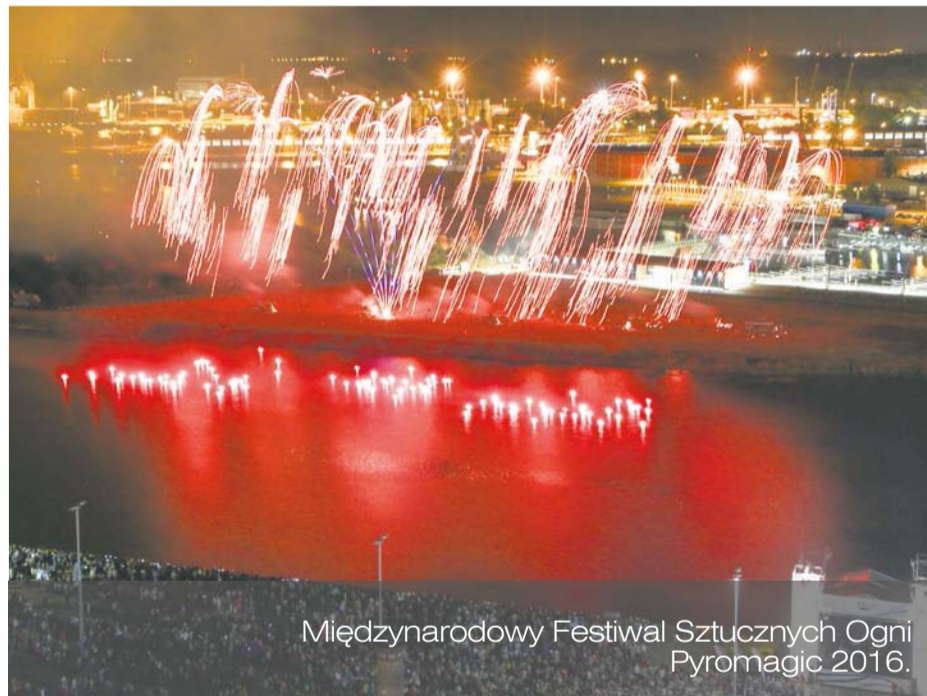
Międzynarodowy Festiwal Sztucznych Ogni Pyromagic 2016.

Na specjalnie położonym parkiecie, udekorowanym girlandami świateł, raz w miesiącu wirowało kilkadziesiąt par, które zwracały się z głośnym apelem, aby w przyszłym roku zdecydowanie zwiększyć częstotliwość potańcówek.