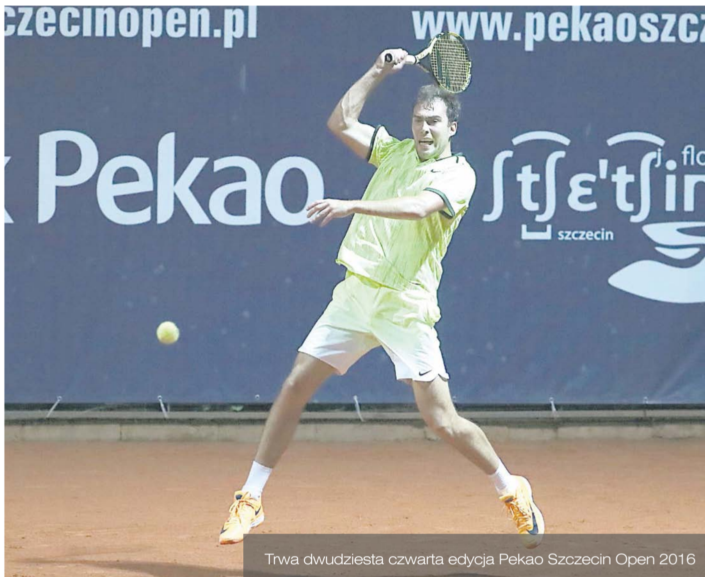
Trwa dwudziesta czwarta edycja Pekao Szczecin Open 2016