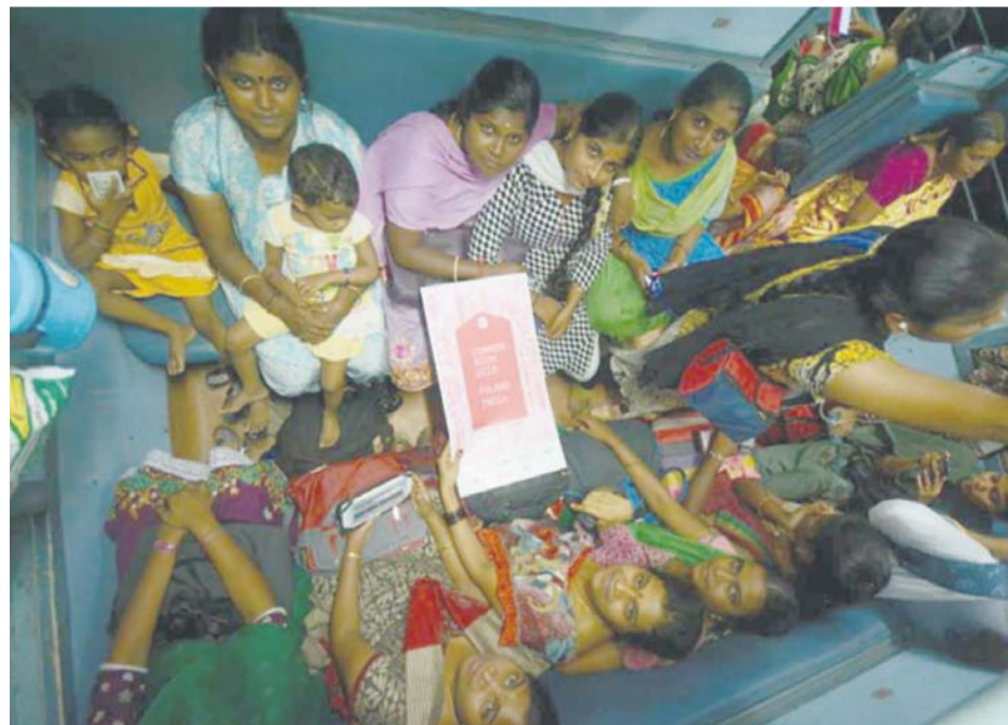
Wspólne warsztaty popularyzujące polską sztukę, kulturę i Szczecin

Ważną ideą projektu Common Room jest tworzenie go przez dzieci dla dzieci (for kids by kids).